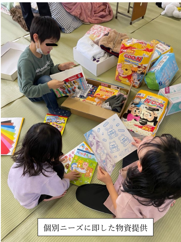
個別ニーズに即した物資提供